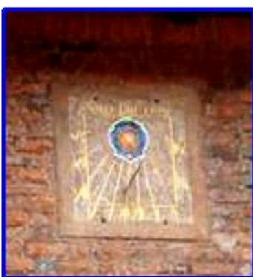
Jeden z nielicznych, działających przez wieki całe zamkowy gnomon (zegar słoneczny). Choć podczas zwiedzania, z powodu braku energii słonecznej czasowo został wyłączony.

Aby wypełnić lukę w planie pracy, z koleżanką i kolegami z zarządu koła zorganizowaliśmy wyjście do muzeum w zamku Biskupów Warmińskich w naszym mieście. Stosownie wcześniej wykonaliśmy około 40 telefonów do członków i sympatyków stowarzyszenia z informacją o zmianie planów i dnia 23 lipca 2011r. o godz. 14 przed muzeum zebrała się nas całkiem spora gromadka. Zanim rozpoczęliśmy zwiedzanie i w oczekiwaniu na panią przewodnik rozmawialiśmy w swoim gronie kto i jak dawno był ostatnio w Zamku. Niektórzy z nas jak się okazało