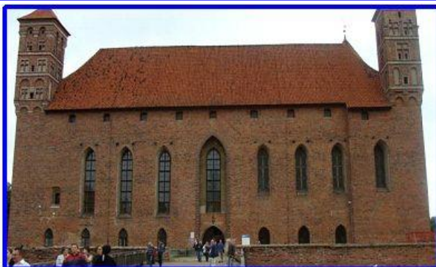
„Ściana frontowa” Zamku Lidzbarskiego, Zamku Biskupów Warmińskich i ich najdowcipniejszego przedstawiciela Ignacego Krasickiego, twórcy niezliczonych bajek, dowcipów i opowieści poetyckich.

Koło SEIRP w Lidzbarku Warm.