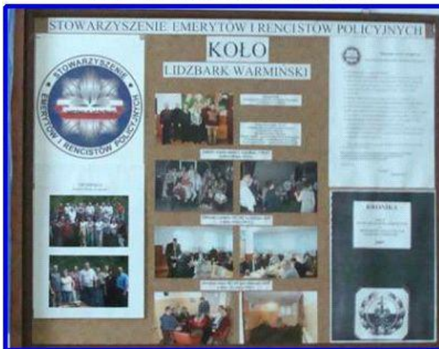
Tablica w holu głównym budynku KPP

4. 20 maja 2011 r. na strzelnicy LOK w Lidzbarku Warm. odbyło się pierwsze w tym roku spotkanie integracyjne członków stowarzyszenia i ich rodzin. Wzięło w nim udział ponad 30 osób. Zabawa była przednia a biesiadników wyprawiła do domów dopiero głęboka i ciemna noc.