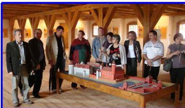
U góry: Makieta Zamku na najwyższej kondygnacji budowli. Trzeba się nieco natrudzić, by wspiąć się tak wysoko po nieco już wydeptanych przez tysiące turystów schodkach. Poniżej: Widok na (całkiem nowo wybudowane) przedzamcze i kompleks hotelowy „Krasicki”. Po lewej stronie zdjęcia, Pałac Biskupa Ignacego Krasickiego