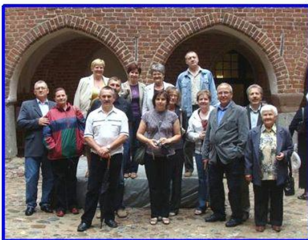
Na dziedzińcu zamkowym, dostatecznie wielkim by pomieścić całą zwiedzającą grupę.